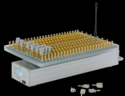
PFE Advanced 100 Outputs