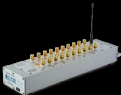
PFE Advanced 10 Outputs